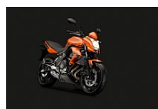
Pearl Blazing Orange