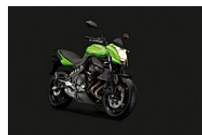
Lime Green / Metallic Flat Spark Black

Priserne er incl. moms men excl. lev. omk på kr.1.790,- Der tages forbehold for ændringer