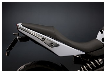
LAVT SÆDE KR 2.833,00