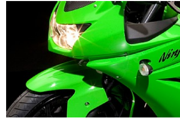
Ser ud som de store