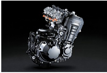
Helt ny motor!