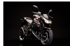
Metallic Chestnut Brown

Priserne er incl. moms men excl. lev. omk på kr.1.790,- Der tages forbehold for ændringer