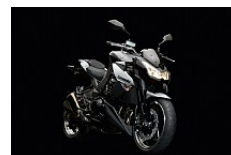
Metallic Spark Black / Atomic Silver