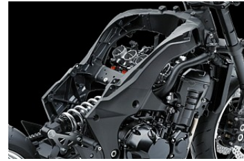
Nyt aluminium stel