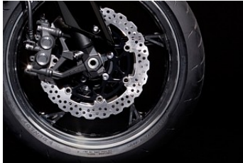
Nye 5 eger hjul