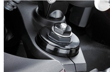
Fuld justerbar forgaffel