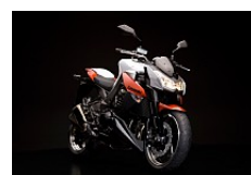
Pearl Stardust White / Candy Burnt Orange