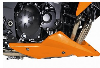
BUNDDÆKSEL Fra KR 3.452,00