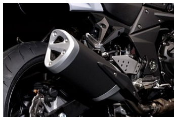
Det er detaljerne der tæller