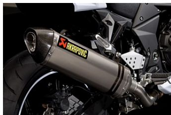
AKRAPOVIC U DSTØDNING*