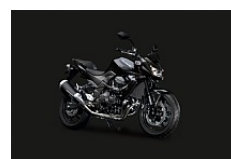
Metallic Spark Black