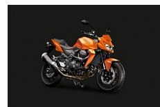
Candy Sparkling Orange