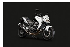
Pearl Stardust White / Metallic Spark Black

Priserne er incl. moms men excl. lev. omk på kr.1.790,- Der tages forbehold for ændringer